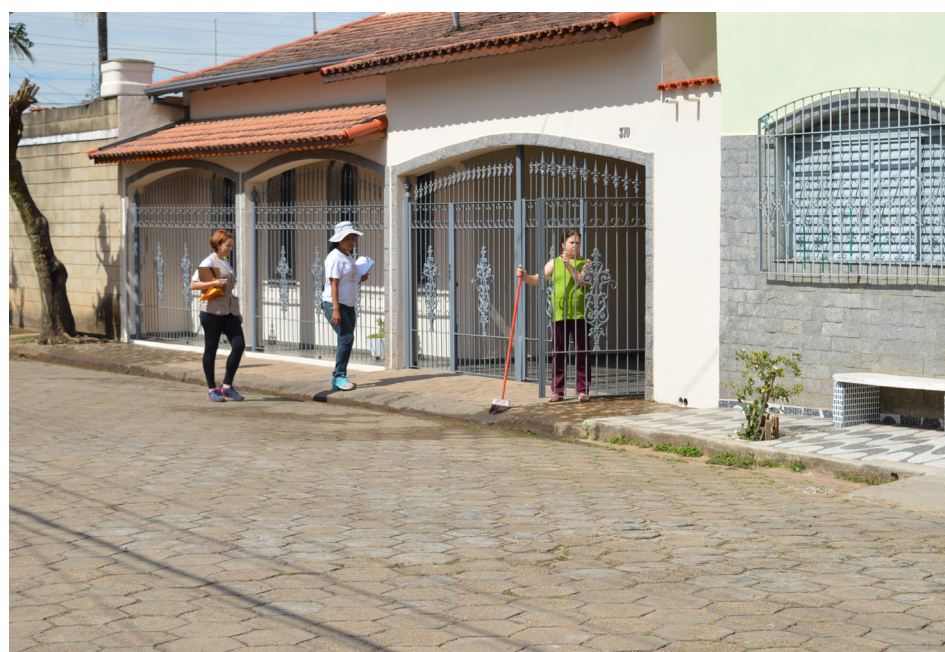
Agêntes da Zoonoses visitam famílias do bairro Santa Lúcia

A campanha A UNIÃO FAZ UMA CIDADE + BONITA aconteceu dos dias 17 ao 21 de agosto na região dos bairros São Camilo, Santa Lúcia e Guanabara. As atividades, tiveram início no dia 17, foram desenvolvidas em três etapas. No dia, 21, os agentes se encontrarão na Escola Municipal Professora Josefa Azevedo Torres, às 07h, para iniciarem os trabalhos de recolhimento de entulhos, visitas as famílias e operação tapa-buracos.