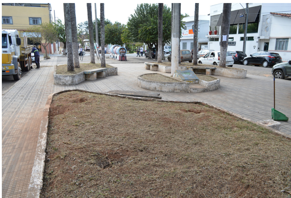
Ação de limpeza na Praça Odilon Pachêco

No dia, 21, parte da região recebeu ações como recolhimento de entulho e orientações